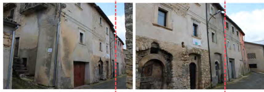
Via della Faina