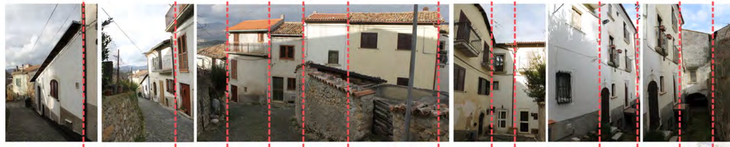
Via Madonna della Neve