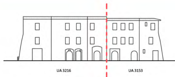
Via della Faina